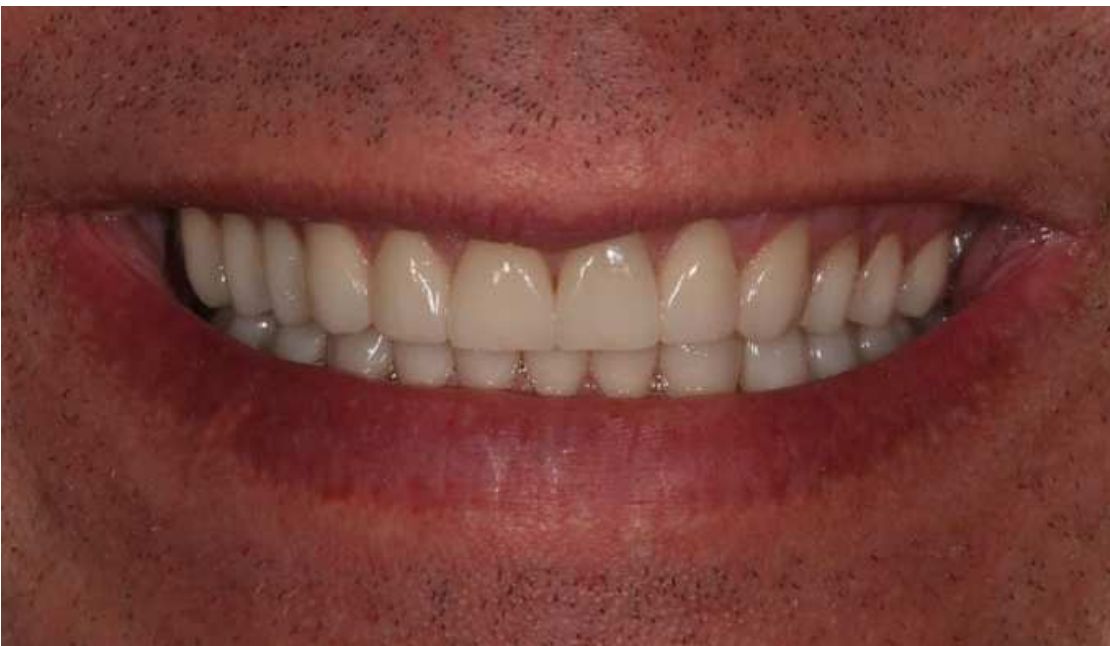
Автор: Ганділян Армен Маміконович, лікар-стоматолог ортопед