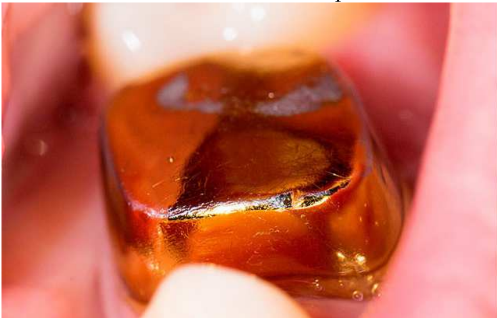
Штампована коронка з нітрид титановим напиленням

Як ви думаєте, хіба такими жувальними поверхнями можна перемелювати їжу, для чого в принципі призначені кутні, тобто жувальні зуби? Звісно, що ні. Такими коронками їжу хіба що можна товкти. Від цього страждає кишково-шлунковий тракт, який отримує погано пережовану їжу, а також скронево-нижньощелепний суглоб, який розрахований на зуби з горбиками, з нормальним фісурно-горбиковим перекриттям і відповідними жувальними рухами, а не на «вертолітні майданчики» з ковзанням цих поверхонь об зуби-антагоністи. Крім того, наведені штамповані коронки виготовлені з різних матеріалів наочно демонструють подібність нітрид титанового напилення і золота. Як мовиться, відчуйте різницю.