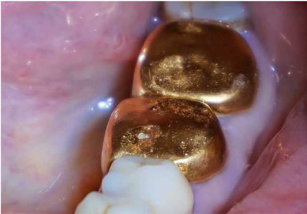
Золоті штамповані коронки