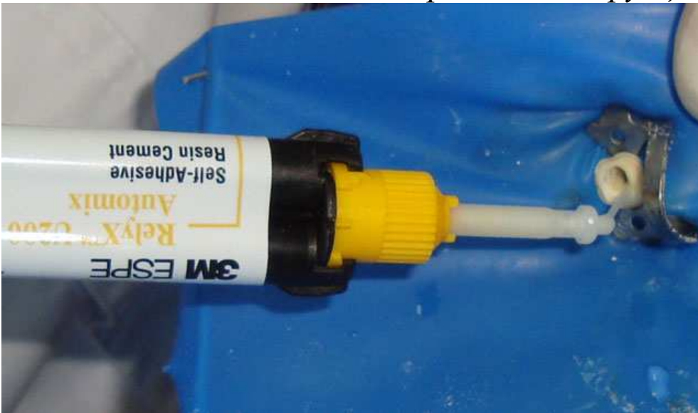
Мал. 7. Автоматичне змішування і внесення матеріалу для фіксації штифтових вкладок