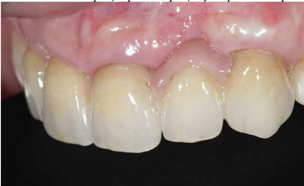
Мал. 19. Біоінтеграція реставрацій у порожнині рота