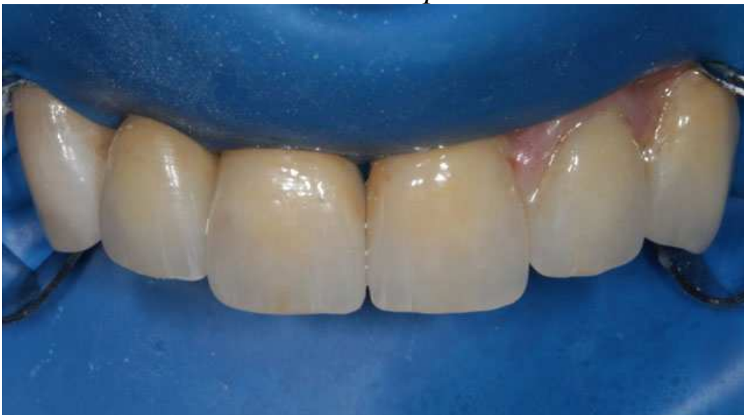
Мал. 17. Реставрації зафіксовані. Перед зняттям кофердаму