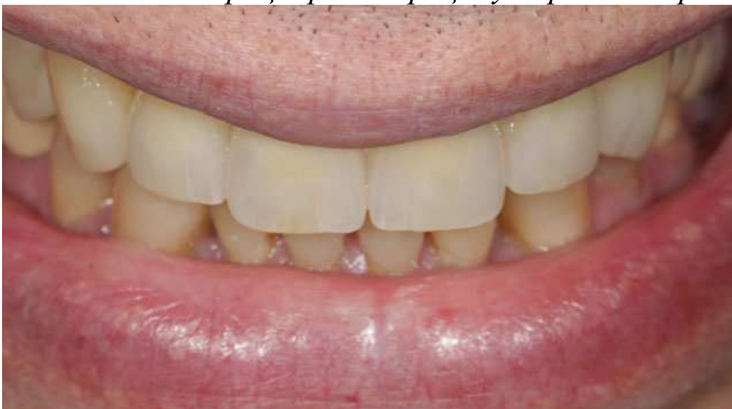
Мал. 20. Посмішка пацієнта

К. Д. Чавушьян, к. м. н., лікар-стоматолог