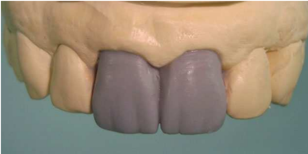
Мал. 10. Воскове моделювання зубів