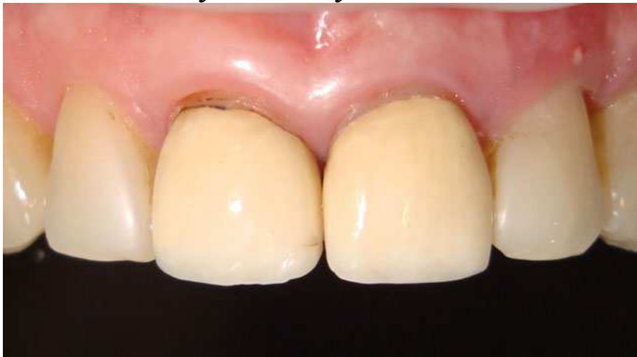
Мал. 1. Ситуація до лікування

Аналіз естетичних показників дозволяє оптимізувати план ортопедичного лікування. При плануванні лікування одним з найважливіших показників є лінія посмішки. У даному клінічному випадку саме низька лінія посмішки дозволила нам вийти з непростой ситуації, отримавши при цьому оптимальну естетику в ділянці відсутнього зуба.