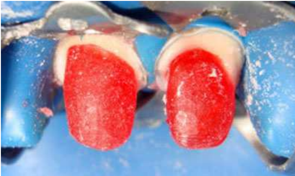
Мал. 6. Відмодельовані штифтові конструкції