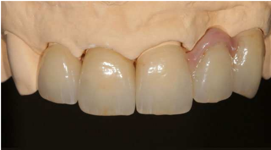
Мал. 13. Керамічні реставрації з штучними яснами