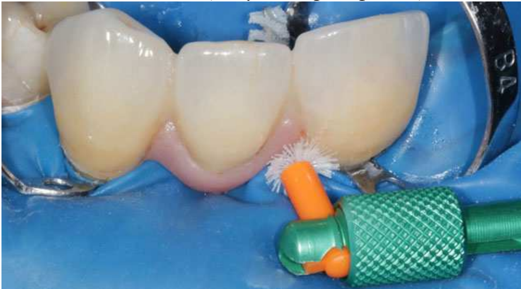
Мал. 16. Усунення надлишків цементу після фіксації за допомогою йоржика