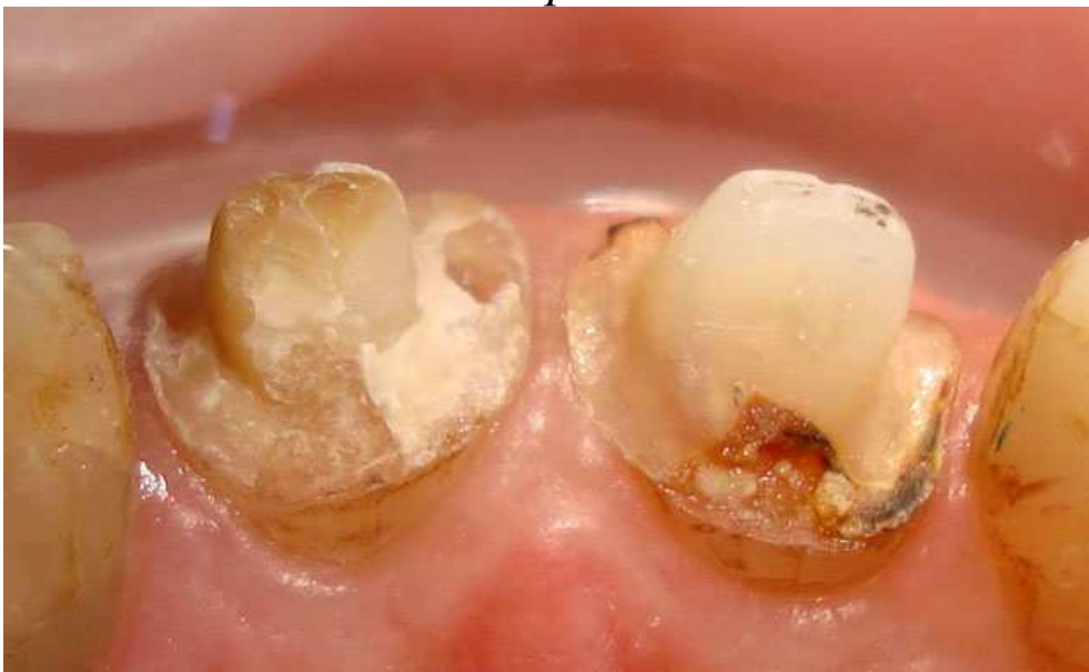
Мал. 4. Стан зубів після зняття реставрацій. Оральна поверхня