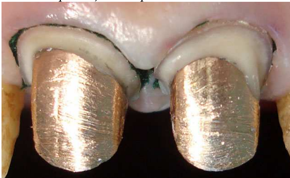
Мал. 8. Штифтові вкладки зафіксовані. Вестибулярна поверхня