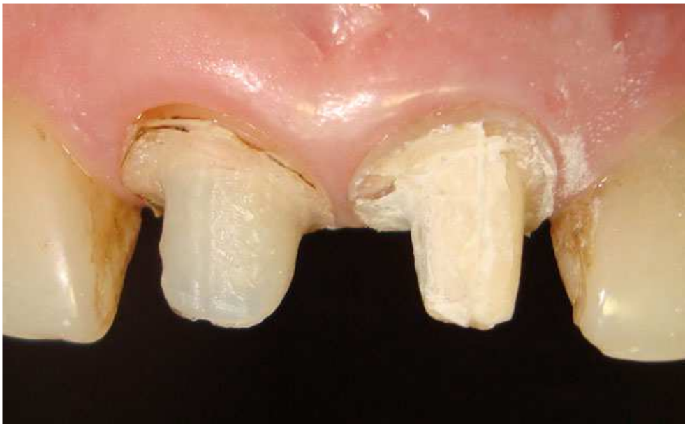
Мал. 3. Стан зубів після зняття реставрацій. Вестибулярна поверхня