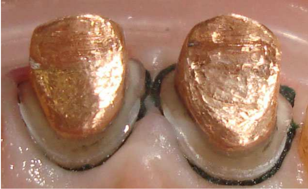
Мал. 9. Штифтові вкладки зафіксовані. Піднебінна поверхня