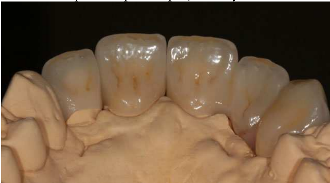
Мал. 14. Керамічні реставрації з штучними яснами