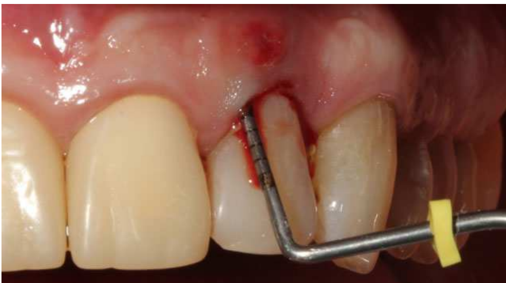
Мал. 11. Видалення зуба 22 за пародонтологічними показаннями