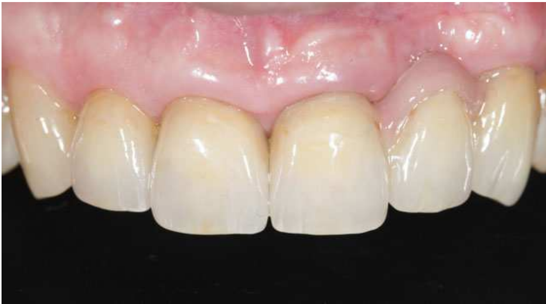
Мал. 18. Біоінтеграція реставрацій у порожнині рота