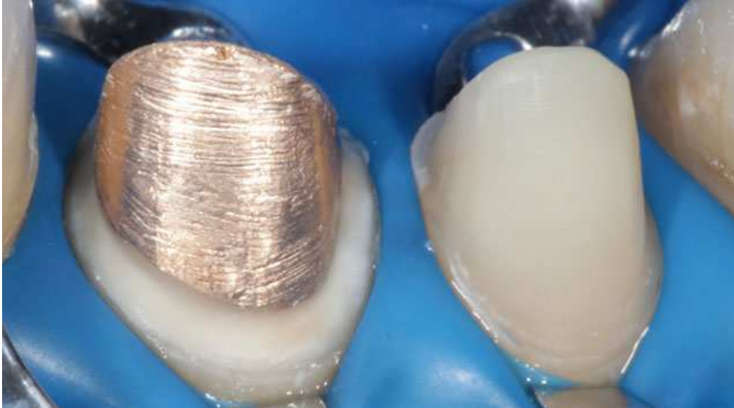
Мал. 15. Ізоляція зубів перед фіксацією