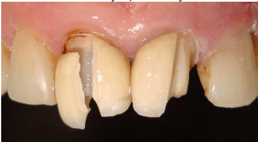
Мал. 2. Зняття старих реставрацій